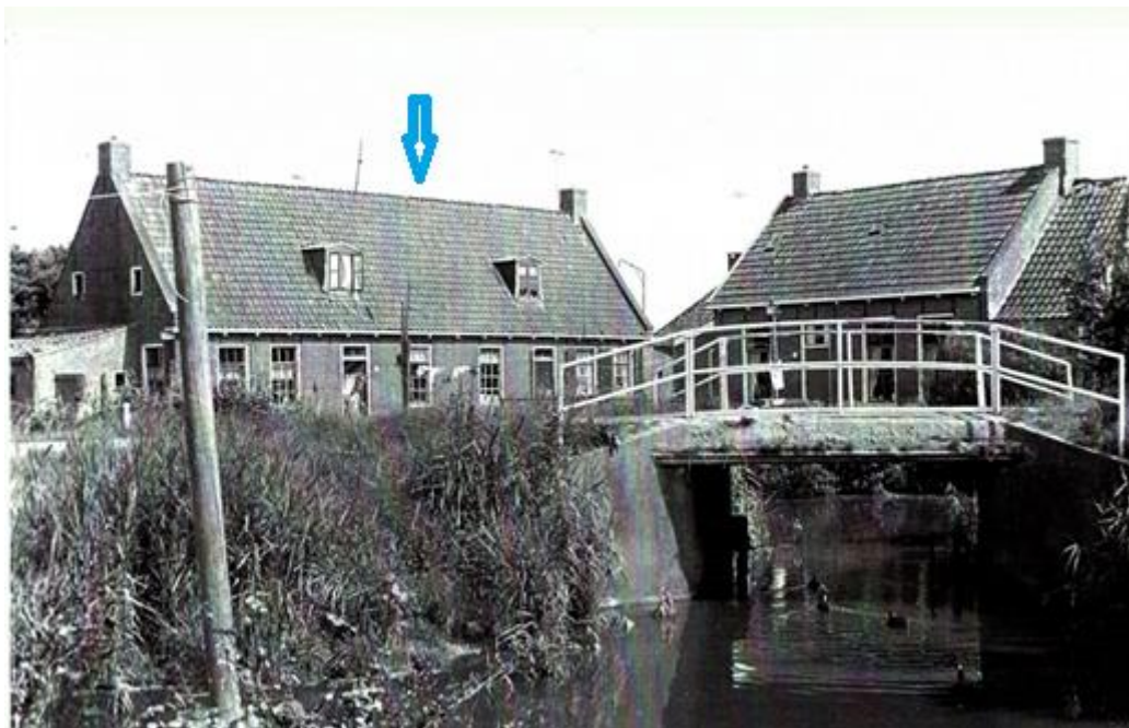
De armvoogdijwoninkjes op Warnserbuorren in 1917.