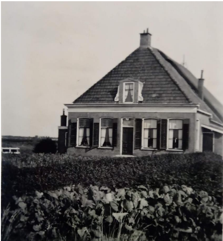
Boerderij Mieddyk 39.