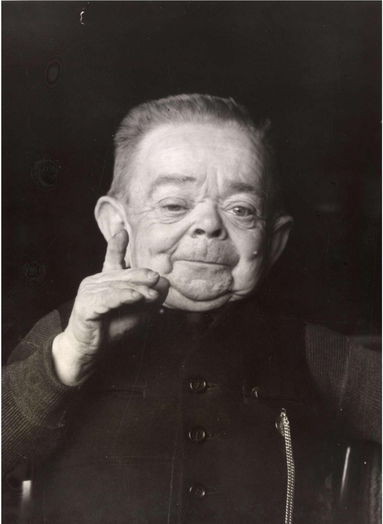
1939, 65 jaar.