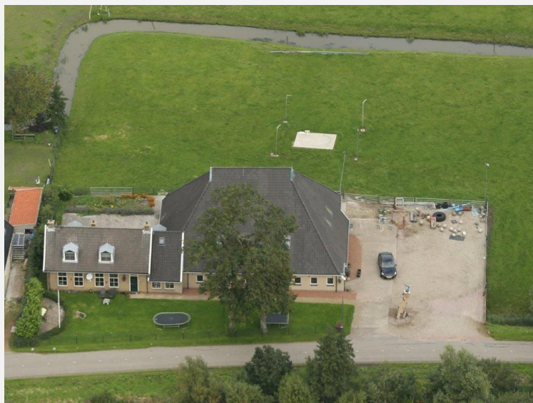
Luchtfoto fan 'e buorkerij