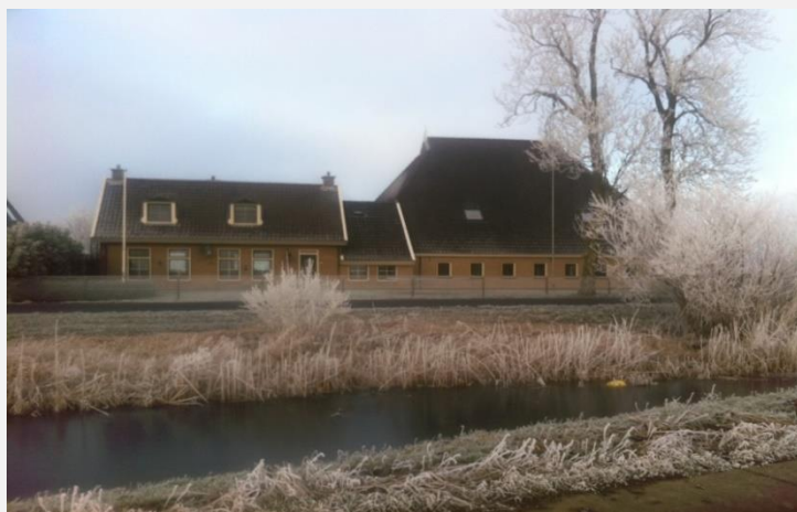
Jannewaris 2017, foto fan'e buorkerij

De húshâlding fan Wout ferhuzet no nei de buorkerij oan'e Tsjaerddyk. Lykwols, Lykwols, ear't se dêr delhúzje, wurdt de skuorre mei de fersakke súdmuorre yngeand oanpakt. De stâl en de golle wurde omtsjoend ta in trainingskompleks foar sterke manlju en froulju. In stikje lân njonken de buorkerij is no it plak foar it goai en smytwurk. (Sjoch ek finster Tsjaerddyk 27)