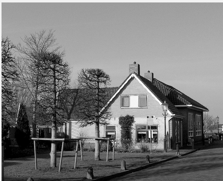
Huidige situatie