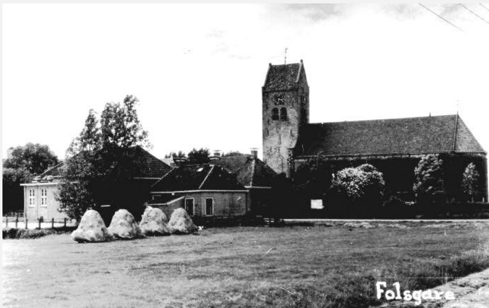
1938, Foto: uitgeverij van der Meulen bv Sneek

Vanaf 1914 wordt het huis achtereenvolgens door meerdere gezinnen bewoond.