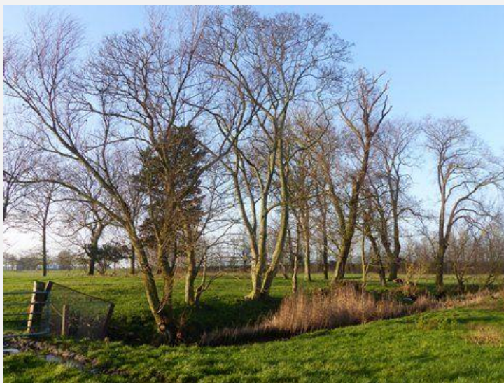
zie ook venster Willem Abma en Carpe Diem

Na korte tijd is van de eens zo mooie boerderij niets meer terug te vinden op een stukje oude gracht, omzoomd door bomen, en laag terpje in het landsch zie ook venster Willem Abma en Carpe Diem