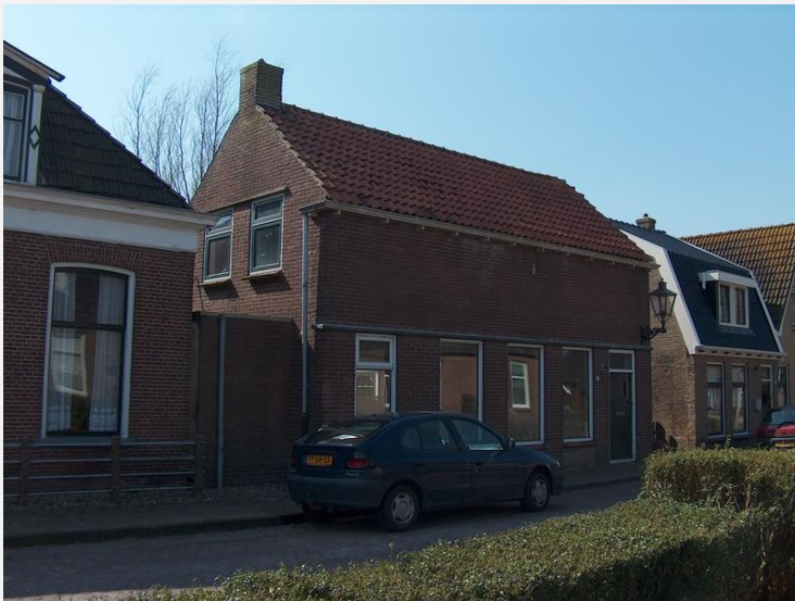
na de laatste verbouwing