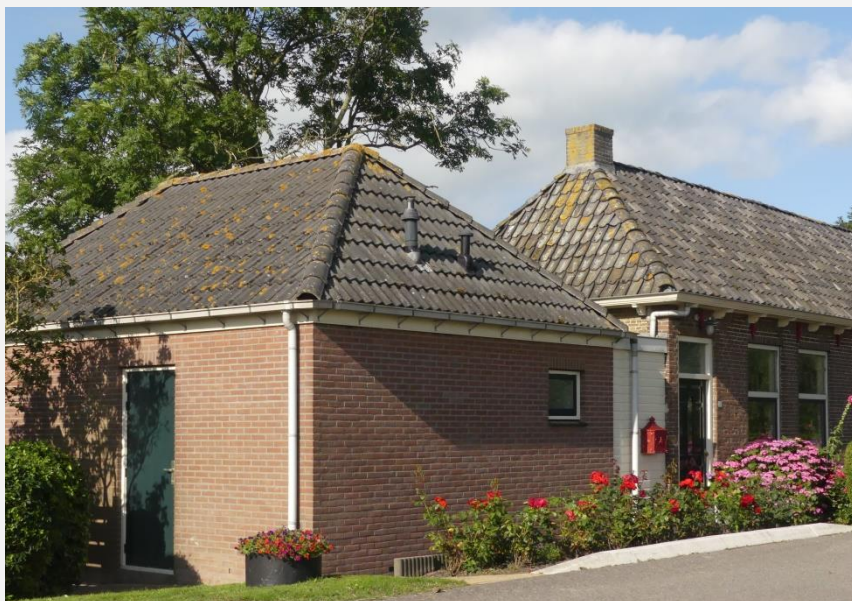
nr 24, situatie 2021

Het reidpôltsje aan de Tsjaerddyk ( nummer 24 en 22)