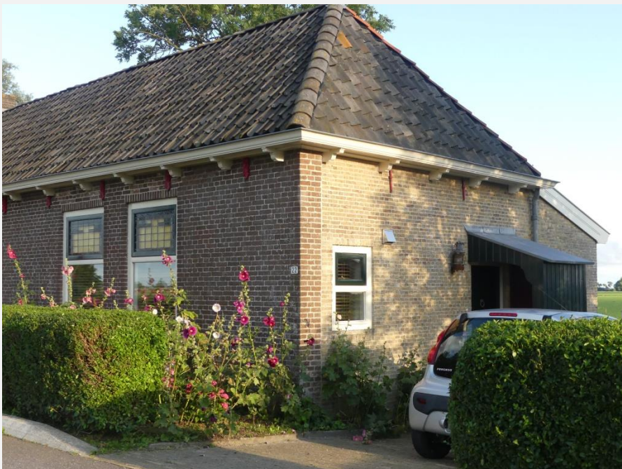
nr 22, situatie 2021