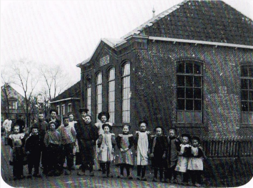
De school na de verbouwing in 1908

en maakt de verbouwing in 1908 mee. Er komt een tweede lokaal en dus moet er ook een tweede leerkracht komen. Dit wordt juffrouw Elisabeth van der Molen.