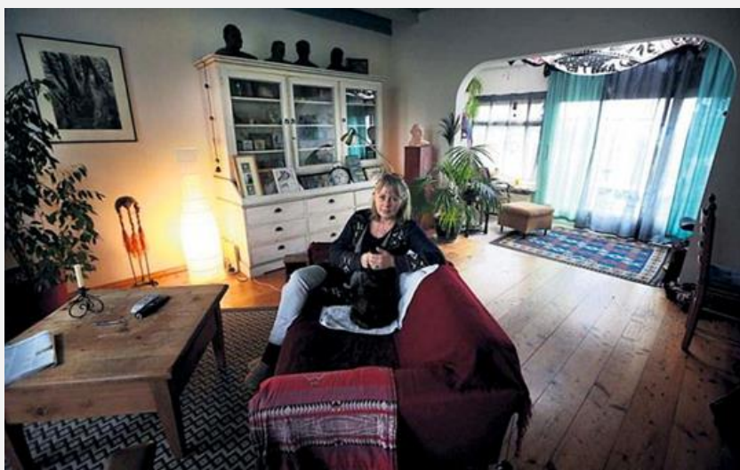
LC 05-12-20

Clasina op'e bank yn har wenning út 1870.