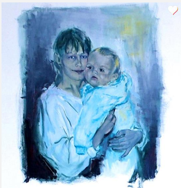
Moeder en kind.

De leafde, de ynmoedige bân, ..... mar foaral it loslitten.