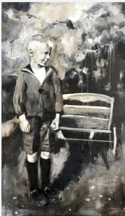
Heit, 7 jier 2020 Oaljeferve op paniel