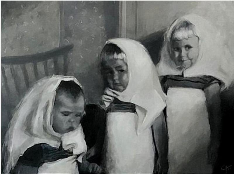
Susterkes 2021 Oaljeferve op paniel Trije suskes Flapper Seis ruften Trije "ferpleechsters"

Clasina fynt it aardich om fan foto's út'e âlde doaze in skilderij te meitsjen.