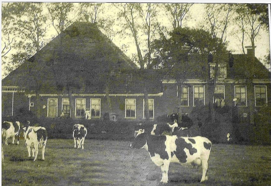
Resultaat na de verbouwing van 1867.

Simon Sipkes Kooistra komt dan samen met Sytske Postma en Trijntje van Wijngaarden, Sytske haar dochter uit haar vorige huwelijk, op Scheender State. Het paar is niet erg tevreden over het woongedeelte. Simon en Sytske laten in 1867 de boel slopen. Ze laten er een nieuwe dwarswoning met een grote kelder neerzetten.