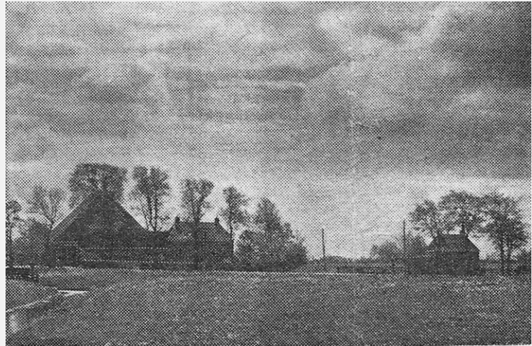
De Kooistra's pleats ûnder Folsgeare

Op de schuur staat het jaartal 1904. Waarschijnlijk heeft Sipke Simons dat jaar een grote verbouwing aan de schuur gedaan.