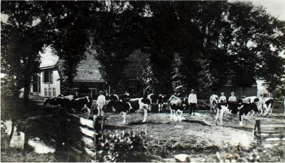
De melkplaats naast de boerderij